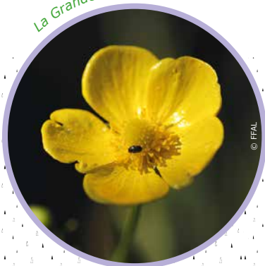
La Grande douve

Le Faux Nénuphar, espèce rare et protégée en Lorraine, forme des tapis importants sur l'étang Picard. Plus petit que les deux autres nénuphars présents dans notre région (le blanc et le jaune), il possède de petites fleurs jaunes se dressant à la surface de l'eau.